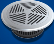
YER DÖŞEME DİFÜZÖRLERİ